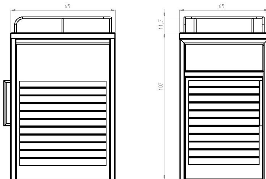
wymiary podano w [cm]